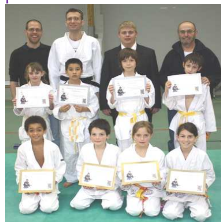
Les poussins diplômés des SREG