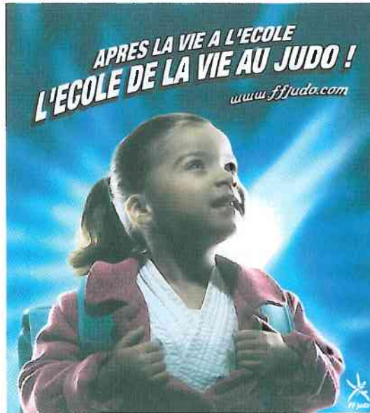
JUDO CLUB SREG MULHOUSE

Chers élèves, parents et enseignants, Chers amis,